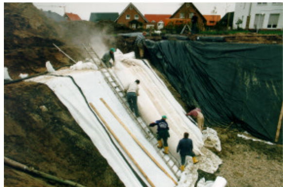
Abb. 5 - Einblasen der 50 cm starken Wärmedämmung auf den Seitenwänden