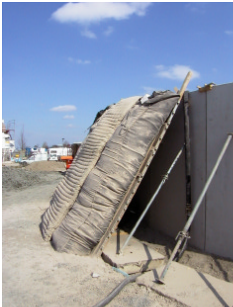
Abb. 3: Ergebnis eines Feldtests: 1 m 3 Wärmedämmung wurde in einer Minute installiert

Die Neuheit bei dem in Steinfurt-Borghorst realisierten Kies/Wasser-Speicher der 3. Generation ist der Wandaufbau. Die Wärmedämmung des Speichers besteht aus einem sowohl hochtemperatur- als auch druckbeständigen Blähglasgranulat, das ein Recyclingprodukt aus der Glasindustrie ist. Durch das Einbringen dieser Wärmedämmung als Schüttgut werden bei geringeren Materialkosten und kürzeren Montagezeiten Kostenvorteile gegenüber Plattenmaterialien erreicht. Dies führt besonders bei großen Wärmespeichern zu einem enormen Kostenreduktionspotential. In Steinfurt wurde das Wärmedämmschüttgut in vorgefertigte, nebeneinander auf die Speicherböschung gelegte, Textilschläuche eingeblasen. Nach einem erfolgreichen Feldtest steht nun ein verbessertes Verfahren zur Verfügung, das eine nochmalige Vereinfachung und Kostenreduktion der Wärmedämminstallation er-