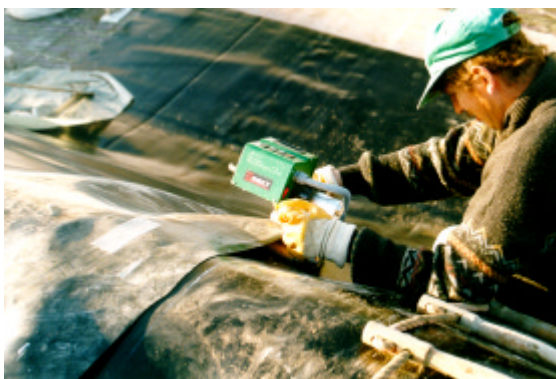
Abb. 6 – Verschweißen der PP-Abdichtfolie