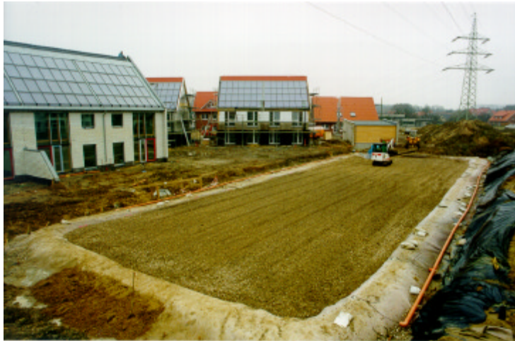
Abb. 7 - Vollständig gefüllter Wärmespeicher