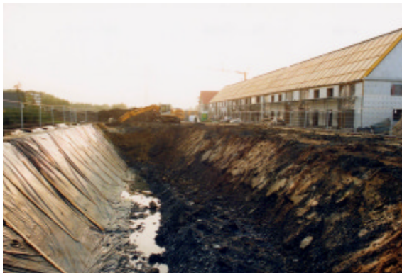
Abb. 4 - Herstellen der natürlichen Speicherböschung

Die Speicherbauphasen des Speichers in Steinfurt werden nachfolgend zusammengefaßt beschrieben. Abb. 4 zeigt die Aushubarbeiten. Es konnte ein natürlicher Böschungswinkel von 50° erreicht werden. Abb. 5 zeigt das Erstellen der Wärmedämmung auf den Speicherwänden mit Blähglasgranulat. Das Wärmedämmschüttgut wird aus einem Silo-LKW in ca. 5 m lange, vorkonfektionierte Textilsäcke, die auf der Böschung ausgelegt sind, eingeblasen. Die PP-Abdichtfolie wird mit verschiedenen Verfahren auf der Baustelle verschweißt. Abb. 6 zeigt die Arbeiten mit einem Heizkeilschweißgerät auf der Speicherwand. Nach Fertigstellung der Speicherwände wird das Speicherbecken befüllt. Abwechselnd wird eine Schicht Kies und eine Ebene der Wärmeübertragungsrohre des Be- und Entladesystems eingebracht. Die Verarbeitung des Kieses wird mit verschiedenen Geräten durchgeführt. Vom LKW wird er direkt in den Speicher geschüttet oder über Bagger eingefüllt. Die Verteilung im Speicher erfolgt durch Minibagger. Der vollständig mit Kies gefüllte Wärmespeicher wird verdichtet und anschließend mit Wasser geflutet (Abb. 7). Danach wird der Speicherdeckel abgedichtet und wärmegeklämt (Abb. 8). Abb. 9 zeigt die als Mietergärten nutzbare Speicherdecke des fertiggestellten Speichers.