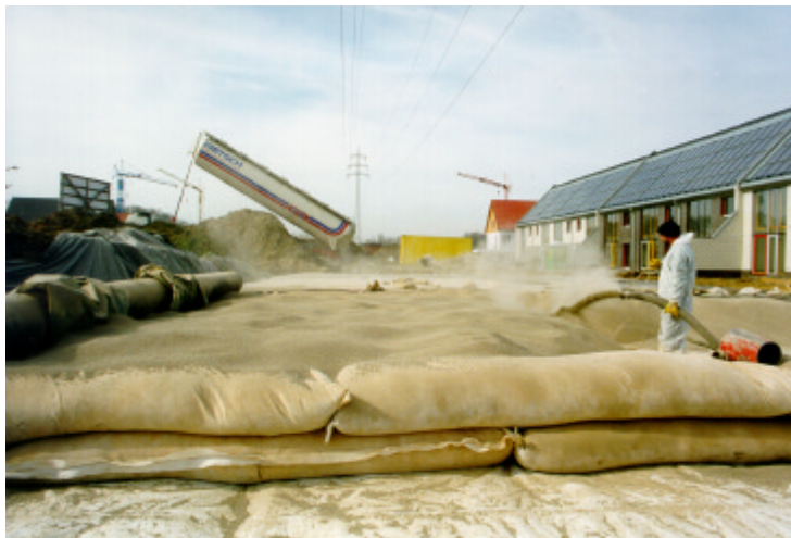
Abb. 8 - Einblasen der Deckenwärmedämmung aus dem Silo-LKW