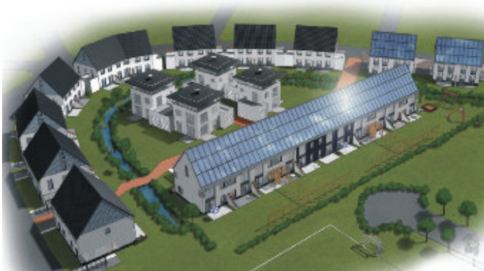
Abb. 2 - Ansicht der Siedlung in Steinfurt-Borghorst

Der erste saisonale Wärmespeicher Deutschlands wurde 1985 am ITW der Universität Stuttgart als Kies/Wasser-Speicher mit 1.050 m 3 Volumen gebaut. Dieser Speicher ist bis heute in Betrieb. 1997 folgte der Bau eines 8.000 m 3 großen Kies/Wasser-Speichers der zweiten Generation für das Solaris Technologie-Zentrum in Chemnitz [1]. In der Solarsiedlung Steinfurt-Borghorst wurde ein saisonaler Kies/Wasser-Wärmespeicher